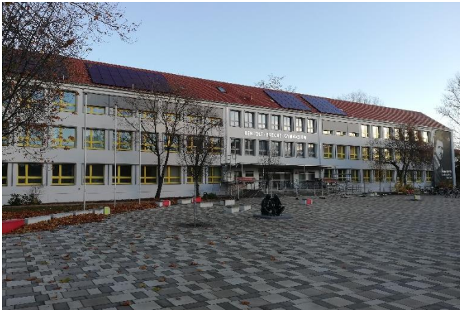
Das „Brecht“ mit neuer Fassade sowie Wärme- und Sonnenschutz

Liebe Schülerinnen und Schüler, sehr geehrte Eltern,